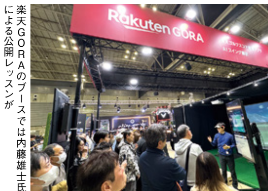
楽天GORAのブースでは内藤雄士氏による公開レッスンが