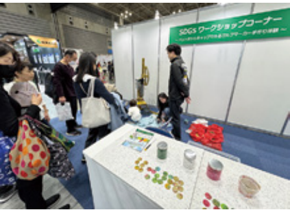
ペットボトルのキャップを素材に、手作りでゴルフマーカーを作成するワークショップも人気だった