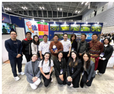
連日盛況だったタイ国政府観光庁のブース。未だに円安が続くがタイゴルフの人気は根強い