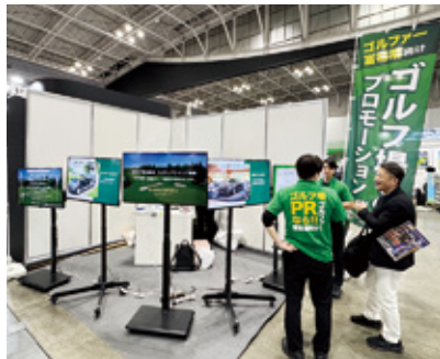
ゴルフ場のデジタルサイネージ「ゴルフアドボックス」を展開する(株)エニアド