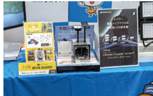
ゴルフ場のナイター照明で高いシェアを持つ岩崎電気は、その技術を用いてカラスやクマといった野生動物対策を展示

今回は20ページに掲載している。期間中に、主催者及び、ゴルフ関連団体による各種セミナーが、パシフィック横浜に隣接するアネックスホールで開催された。各種セミナーの様子は20ページに掲載している。