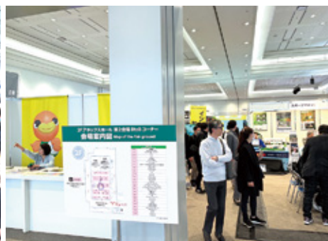
今回からJGRA関連出展コーナーはBtoB向けとしてアネックスホールで展示

8796人、10日…1万4459人)。 前年に続き、学生や18歳未満、出展社、プレスなどは無料となっており、有料での入場者には会場内の主催者企画及び、出展社ブースで使用できる「特別クーポン券1000円分」が配布されていた。 なお、特に今回主要ターゲットとして設定した「40〜60代のアクティブゴルファー」が全体の来場者数を強く牽引し、「より深くゴルフを楽しみたい」という層の熱度が来場者数を押し上げた。さらに、30〜40代の来場比率が昨年比3.6%増と伸びた他、年間ラウンド数0〜1回の新規・ライト層も昨年比7.7%増、女性層も昨年比1.2%増とそれぞれ増加した。 今年は「100年ゴルフ」をコンセプトに掲げ、「ファン」、「ヘルス」、「テック」、「トレンド」の4つのテーマに沿ってサステナブルで生涯続けられるゴルフの魅力を展開。会場内では各テーマに基づいた多様なコンテンツが大きな反響を呼び、ニアピン・ドラコンチャレンジ、レッスンコーナー、試打コーナーの充実、専門家による