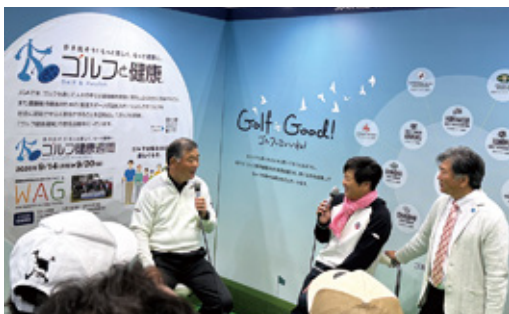
「自律神経コントロールによるゴルフと健康」をテーマに、中嶋常幸氏と横田真一氏のスペシャルトークショーを実施（JGAゴルフ振興推進本部）