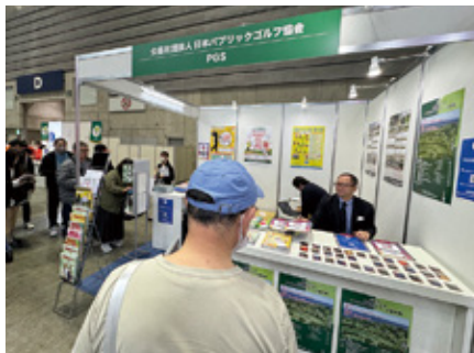
競技ゴルファーから注目を集めた日本パブリックゴルフ協会