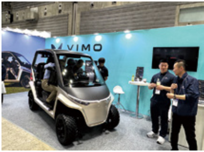
今年の夏に販売を開始する、自動車レベルの安全性と快適性を備えた新世代ゴルフカートを展示 (VIMO株)

ゴルフショットを手元に残せる「Good Shot」を展示 (エイチ・アイ・エス)