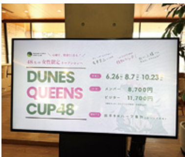
人気の48名の女性限定のオープンコンペ「Dunes Queens Cup 48」

新体制となり、今年飛躍するために昨年は準備期間でもあったそう。今年度は会員募集に