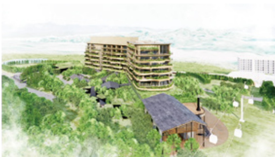
シックスセンス妙高の完成予想図

「長野県はポテンシャルが高く、非常に魅力的なエリアです。インバウンド集客は力を入れていきたい部分ではあります。系列の妙高杉ノ原スキー場は巨大なスキー場で雪質もしっかりしていて人気なのですが、周辺に大きいホテルがないのです。そのため、グレンデに寄り添うマウンテンホテル及びレジデンス（シックスセンス妙高）が建