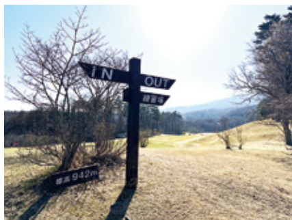
夏場でも涼しい環境でプレーできる避暑地リゾート

収分割。効力発生日は同年9月 1日で同日からゴルフ場名称を 変更した。運営スタイルや従業 員、会員の権利については変更 なかった。そして同年6月28日 に会員権の名義書換えを停止し た。