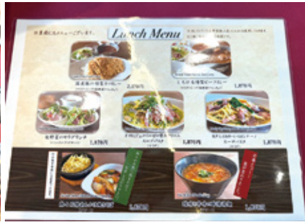
リゾートコースとあってレストランメニューもバラエティに富んでいる（画像は一番人気の酸辣と辛味の酢辣湯麺）

会員を増やし、今後はクラブ 対抗をはじめ、月例などの競技 にも注力していきたいので、日 本ゴルフ協会（JGA）及び関 東ゴルフ連盟（KGA）への加