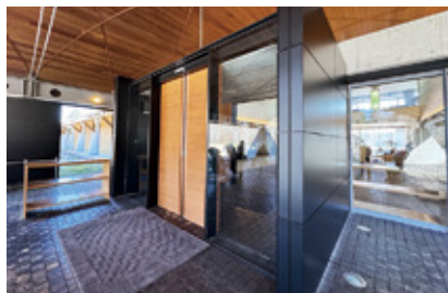
塗り替えて高級感が出たクラブハウスの入り口

イブ・アドバイザーに就いてい る。 なお、同CCは経営交代後、 2025年4月12日に新体制で オープンした。 「リブランドオープン後に注力 したことは、余計に感じられた