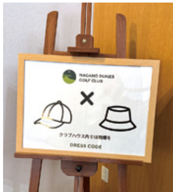
経営交代して館内サインも一新