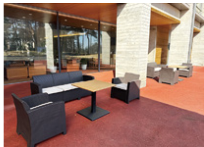
ここでバーベキューを検討中