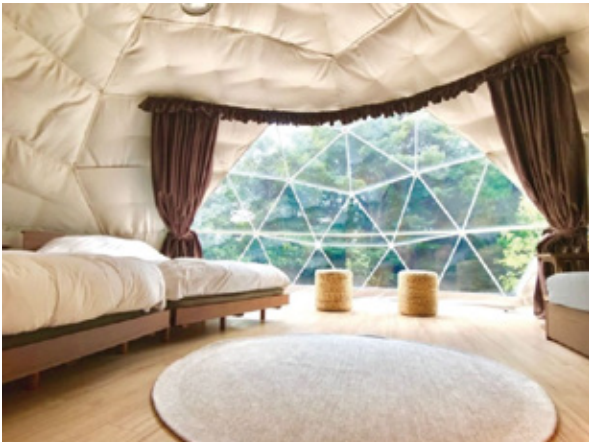
紫塚GCのグランピング施設

「グランピングを楽しみながら仕事ができるワーケーションのため本格施設を設けて、ワーケーション事業に挑戦する。ゴルフ初心者や子供を対象に、ゴルフ場併設のゴルフ練習場を改修し、ゴルフアカデミー事業を開設する」事業概要。同社は、昨年8月1日にグランピング施設の「Haga Farm & Glamping」をオープンしていた。 同社に今回の採択を尋ねると、「ワーケーション事業とゴルフアカデミー事業は、共に以前より予定