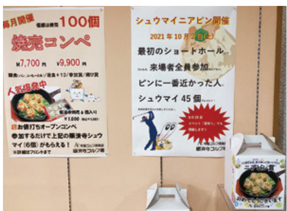
大人気の焼売イベント。焼売をテイクアウトするゴルフファーマかなり多いという