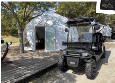
ゴルフ場内の移動もバギーカートでアクティブ に楽しめる