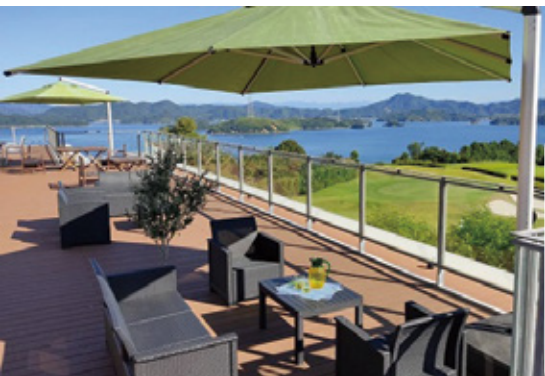
朝食は絶景テラスでモーニングセットを堪能できる