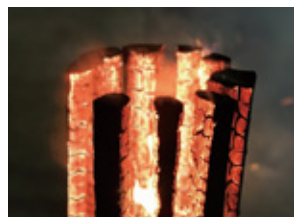
スウェーデントーチは、 炎が際立つので インスタ映えにおすすめ