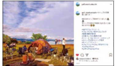
各ゴルフ場のInstagram（左よりコスギリリゾート阿蘇ハイランド、キャメルゴルフ&ホテルリゾート、瀬戸内ゴルフリゾート）