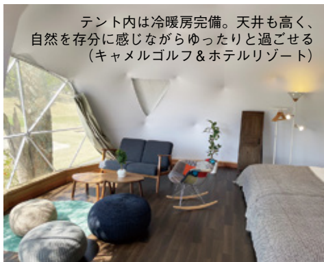
テント内は冷暖房完備。天井も高く、 自然を存分に感じながらゆったりと過ごせる (キャメルゴルフ&ホテルリゾート)